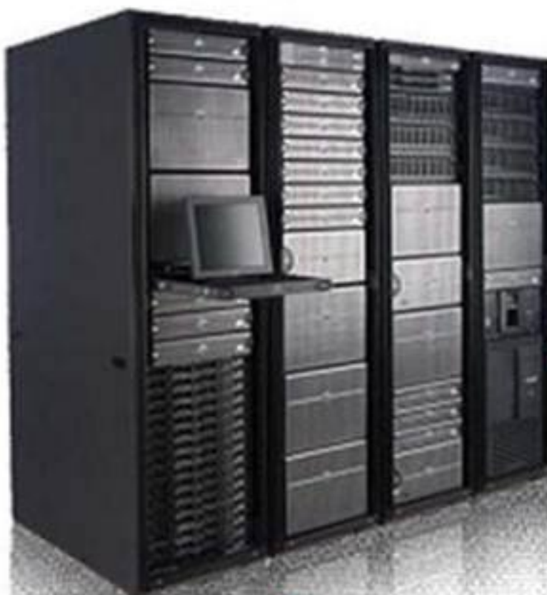
Hệ thống Server